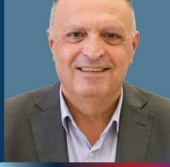
ناصر أبو بكر

رئيس مجلس إدارة وكالة الانباء الاردنية (بترا)