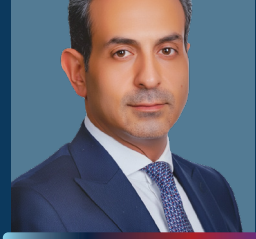
المحامي محمد قطيشات

نقيب الصحفيين الفلسطينيين نائب رئيس الاتحاد الدولي للصحفيين. رام الله، فلسطين