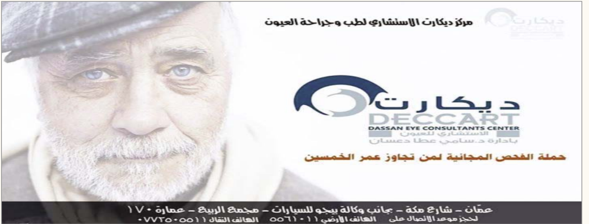
مركز ديكارت الاستشاري لطب وجراحة العيون